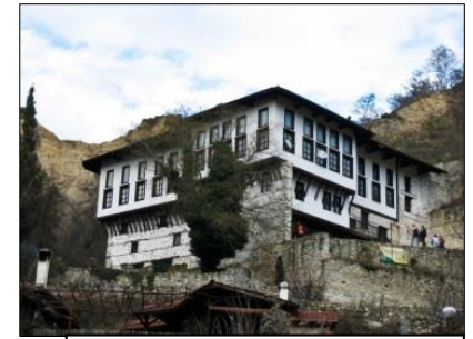
Melnik grüßt mit seinem milden Klima und aromatischen

Es gelten die Allgemeinen Reisebedingungen.