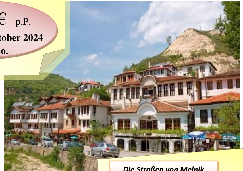
Die Straßen von Melnik