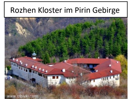
Rozhen Kloster im Pirin Gebirge